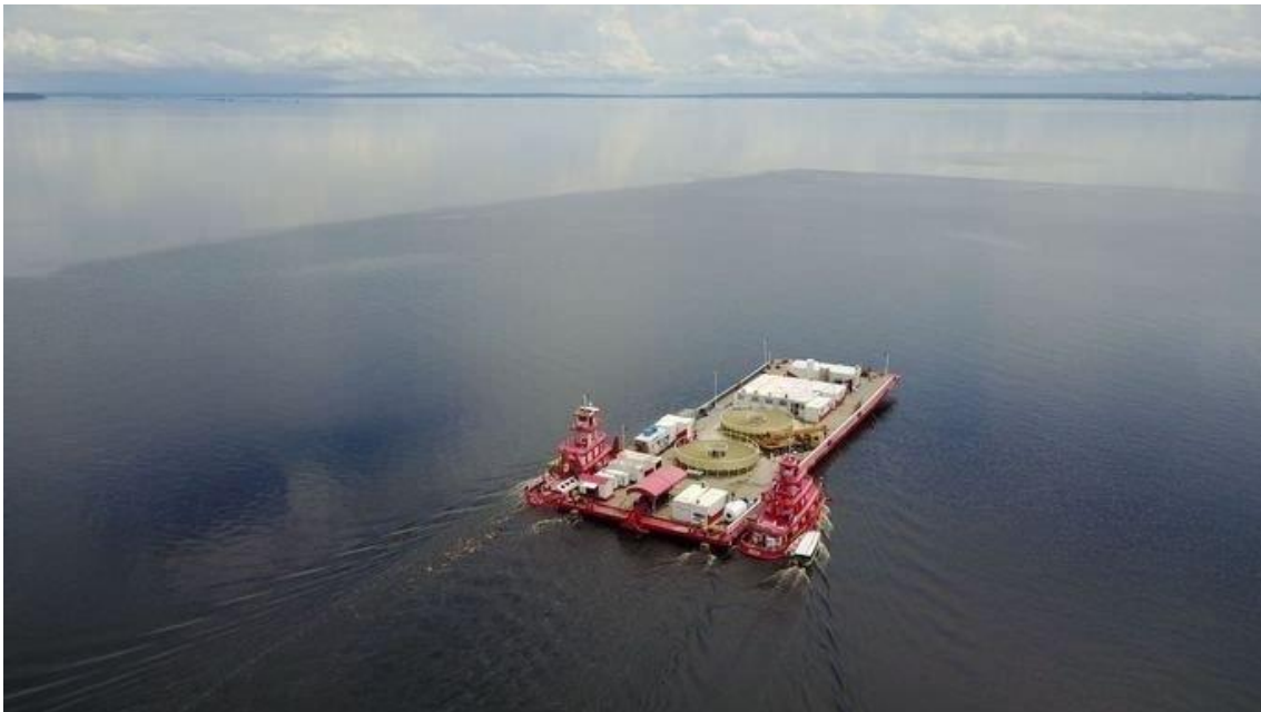
Embarcação de lançamento do cabo óptico subfluvial no rio Solimões, entre as cidades de Manaus, Manacapuru e Coari.

Feito isso, é realizado o projeto do traçado do cabo, a sua chegada em diversos pontos na margem e um correspondente plano para o lançamento. Feito isso, é preciso encomendar o cabo, de acordo com as recomendações para o seu lançamento e a previsão de sua acomodação no leito do rio. O cabo é normalmente muito longo, tem custo elevado e, também, é muito pesado. Fala-se aqui de trechos de cabos de algumas centenas de quilômetros entre cada município onde o cabo é “aterrado”, ou seja, dirigido à margem do rio para ser interligado com a rede terrestre de comunicações.