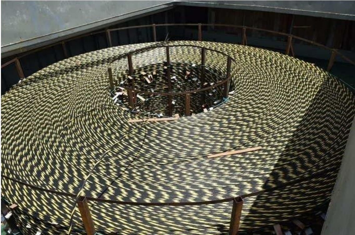
Cabo de fibra óptica preparado para ser lançado nos rios Negro e Solimões – FOTO: Comando Militar da Amazônia

As fibras ópticas são muito sensíveis, podendo as suas características serem alteradas, e, por causa disso, os cabos que as contém possuem uma série de elementos construtivos e de fabricação que visam proteger as fibras de quaisquer danos. Ao serem transportados, armazenados e instalados, os cabos de fibras ópticas devem ser tratados com muito cuidado, para evitar danos e a deterioração ou inutilização do cabo ou parte dele. Trata-se de se assegurar que o cabo tenha uma vida de operação bem longa, tipicamente 25 anos.