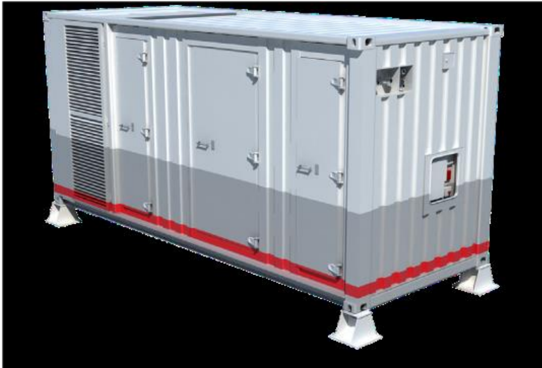
Exemplo de container para estação de aterragem (Truckvan)

É neles que se distribuem a capacidade de comunicação do cabo óptico da infovia, assim como, concentram para o cabo óptico da infovia as comunicações a serem enviadas para outros lugares. As Estações de Aterragem contêm os equipamentos de comunicação de dados ópticos e eletrônicos e, além disso, monitoram os enlaces de comunicação, asseguram energia ininterrupta aos equipamentos e permitem o controle dos mesmos a distância.